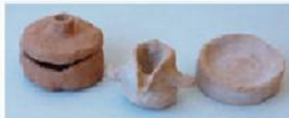
Macina, anfora, piatto

Adulti che, nel male e nel bene, non si interessano quasi affatto di ciò che fanno i bambini e le bambine che girano e