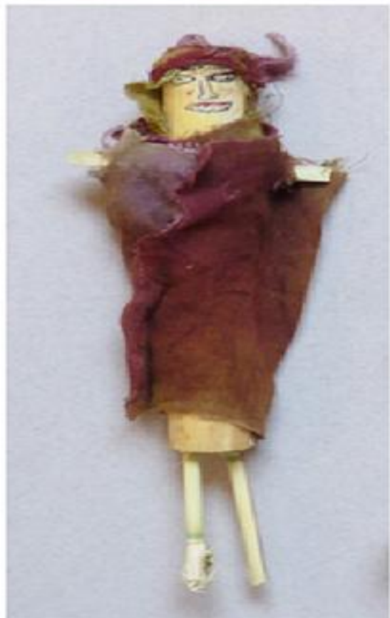
Bambole con gambe e disegno del viso