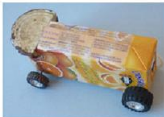
il camion Orangina

Sostanzialmente vige il principio che, come per gli animali l'istinto al gioco è agito fintanto che non si esaurisce da se (all'interno di un contesto protetto), così gli studenti parteciperanno alle lezioni quando saranno intrinsecamente motivati a farlo, e non prima che abbiano maturato un pieno senso di