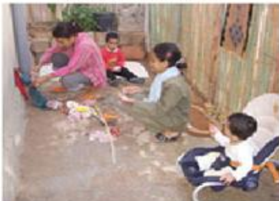
giocare la famiglia nel retro della casa

Ed in terra non si trovano solo gli scarti del mondo degli adulti, ma si possono anche trovare giocattoli fatti da queste piccole dita e poi "abbandonati" poco dopo averci giocato. "Abbandonati" non è la parola giusta, non certo per la carica emotiva che noi vi potremmo associare.