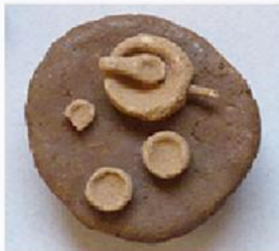
tavolo tondo basso con piatti