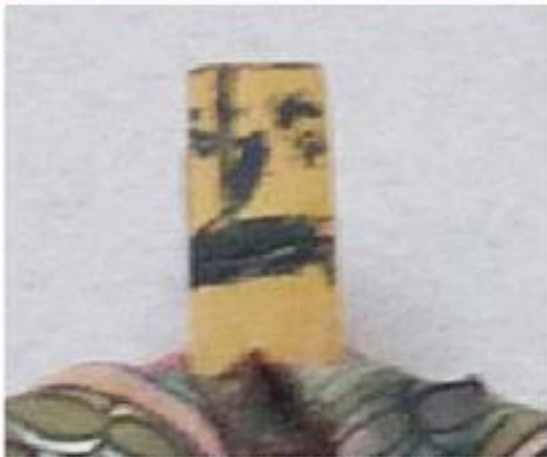
tratti di visi disegnati sui bastoncini che fanno da struttura croce per la bambola tradizionale