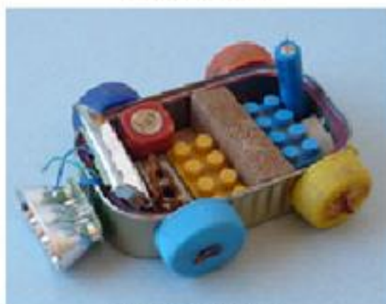
l'auto a batteria