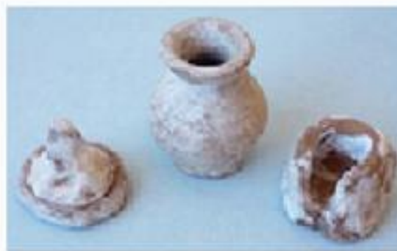
Macina, anfora e mortaio